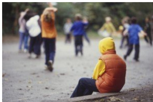
Ils ne veulent pas me laisser jouer!