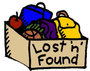
J'ai perdu quelque chose!