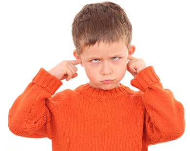
On ne m'écoute pas!