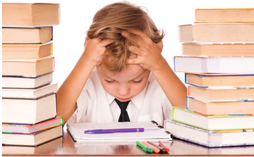
C'est un peu trop!