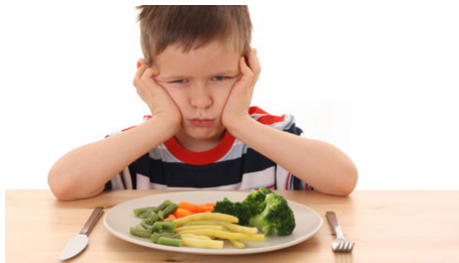
Je n'aime pas mon repas!