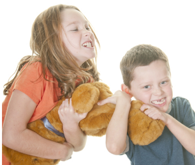
Je le veux!