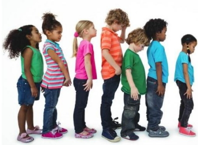
Je ne veux pas attendre!