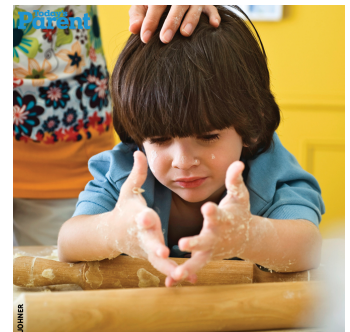
J'ai fait un dégât!