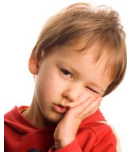
Je suis fatigué!