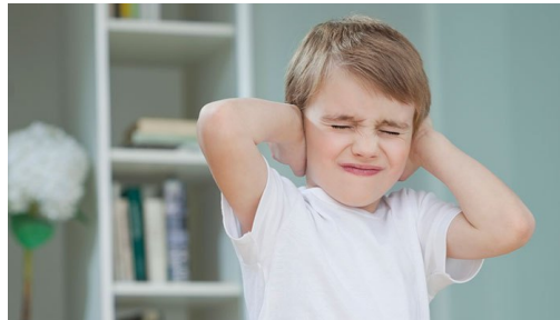
Il y a trop de bruit!