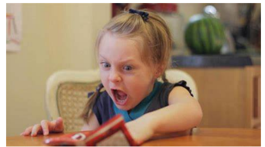
Ça ne fonctionne pas!