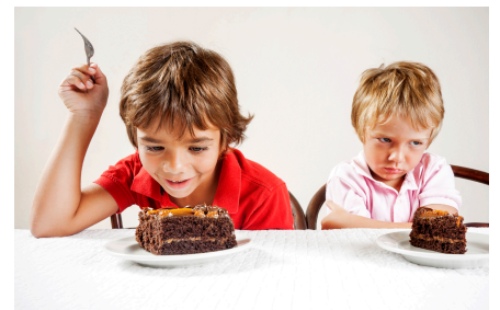
Ce n'est pas juste!