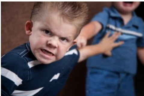
J'ai besoin d'aide!