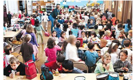
Il y a trop de monde!