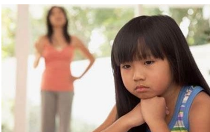
Un adulte a dit non!