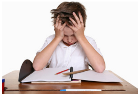
Je ne comprends pas!