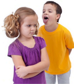
Il n'est pas gentil avec moi!